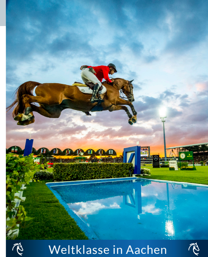
Weltklasse in Aachen